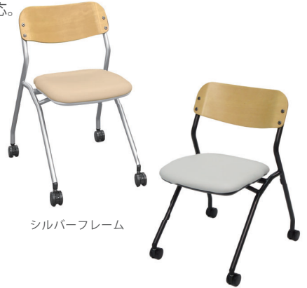
シルバーフレーム