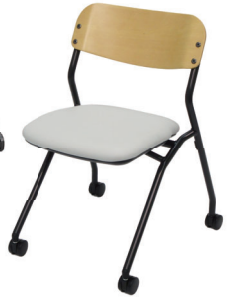
ブラックフレーム